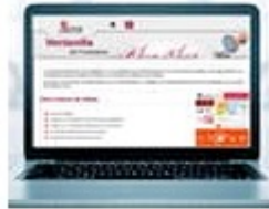
Ventanilla Ciudadano. Notificaciones electrónicas